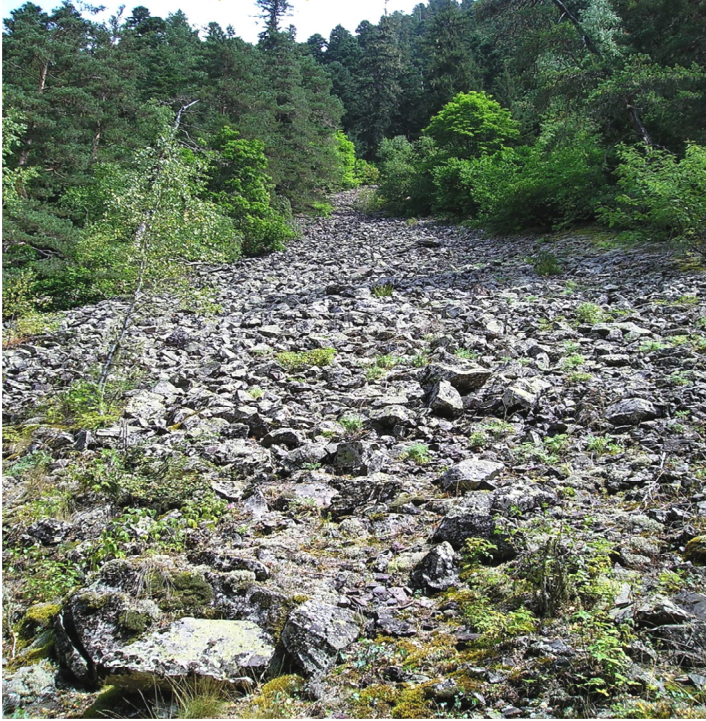
Рис. 27. Десертция. Большой Кавказ. Район п. Архыз ( http://www.popovgeo.professorjournal.ru/ )

Осыпание (камнепад, осыпь) – осыпание, скатывание, скольжение, перемещение скачками обломков по относительно крутым склонам сухого обломочного материала разного размера – от глыб, щебня до песка. Может происходить плащеобразно или концентрируясь по узким линиям и ложбинам. Формируется осыпь, поверхность которой представляет собой естественный откос крутизной до 30–40° (рис. 28, 29).