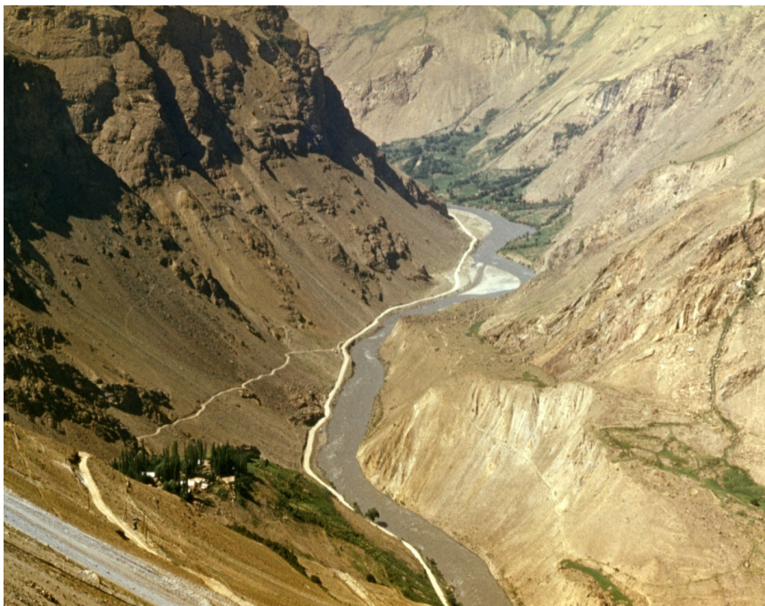
Рис. 15. Рельеф долины р. Пяндж. Юго-Западный Памир, кишлак Кухи-Лал

В средней части гор (1500–2000 м), особенно в облесенных районах, на первое место выходят процессы эрозии и плоскостного смыва с локальным проявлением обвалов, осыпей и оползней. В верхней части гор, а также в высокогорье (свыше 2000 м) ведущее рельефообразующее значение приобретают физическое выветривание и ледниково-нивальные процессы (рис. 16, 17).