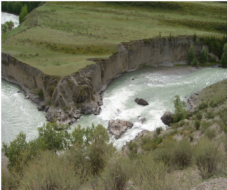
Рис. 52. Склон эрозионный. Река Катунь. Горный Алтай