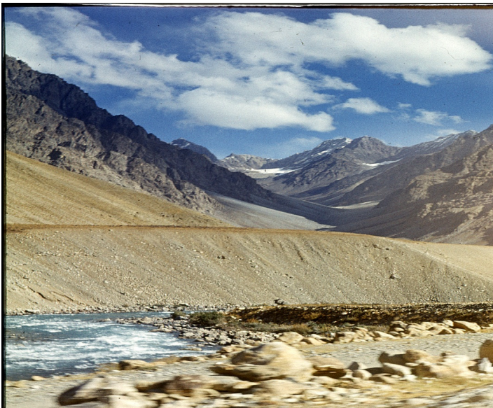
Рис. 50. Склон денудационно-эрозионный. Восточный Памир