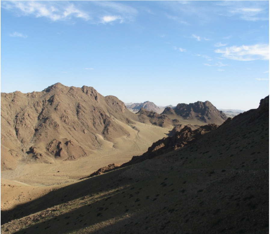
Рис. 4. Эоловая аккумуляция – формирование висячих дюн. Халдзан-Бурэгтэг. Западная Монголия