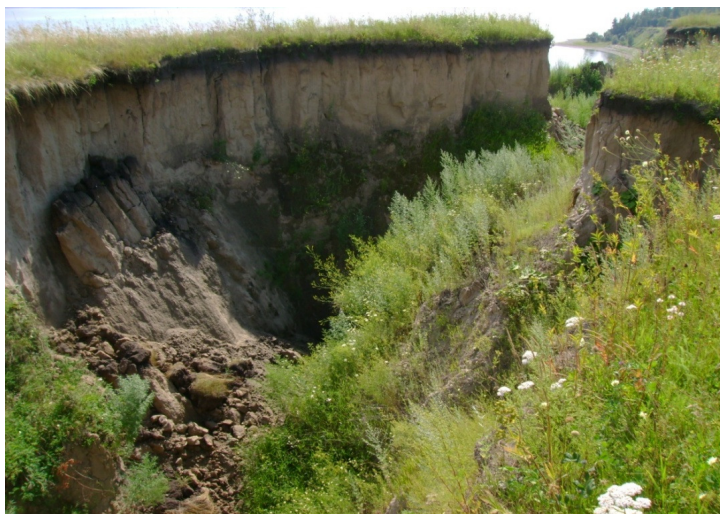
Рис. 30. Процессы отседания. Красноярское водохранилище

Смыв плоскостной (смыв делювиальный, смыв склоновый) – работа текучей воды (дождевой и талой), более или менее равномерной по всей площади склонов (сплошной «водной пеленой»). Нередко сюда же относят и струйчатый (бороздчатый) размыв, когда сток происходит струями по мелким руслам, постоянно меняющим свое расположение. Смыв плоскостной характерен для аридных, семиаридных районов, где стоку не препятствует скудная растительность.