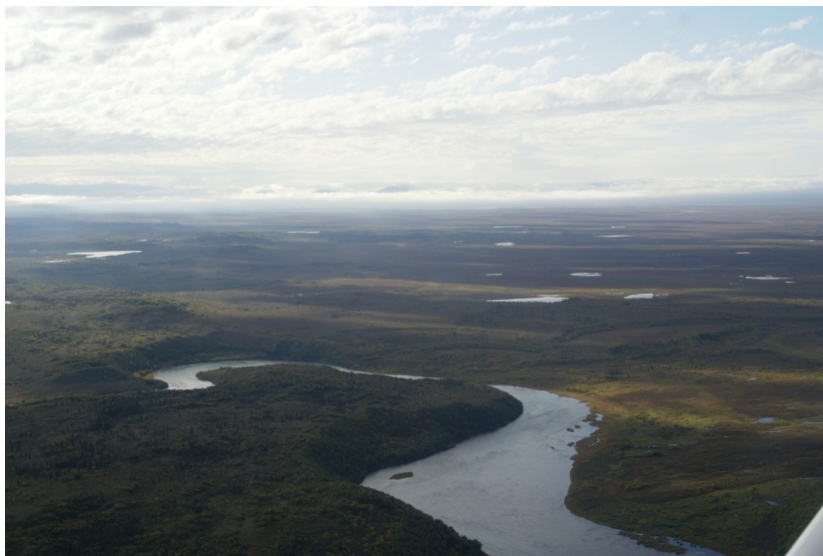
Рис. 26. Термокарстовые озера. Аляска

Термокарст – процесс протаивания многолетнемерзлых грунтов и горных пород, содержащих лед, что сопровождается локальным проседанием поверхности и образованием отрицательных форм рельефа (замкнутых впадин, западин, блюдце) (рис. 26). Возникает при изменении теплового режима грунта, при вырубке леса, распашке полей, при потеплении климата.