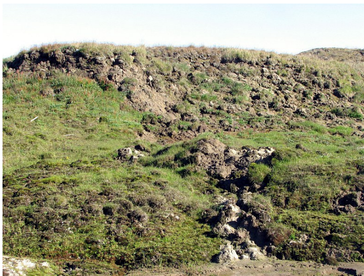
Рис. 31. Процесс солифлюкции

Процессы эоловые (от Эола – бога ветров в древнегреческой мифологии) – все процессы, обусловленные деятельностью ветра. Состоят из процессов дефляции (выдувания и развевания), корразии (обтачивания), переноса и аккумуляции (накопления). В результате деятельности процессов эоловых возникают эоловые формы рельефа и отложения.