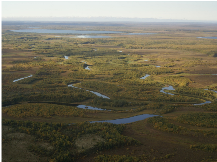
Рис. 19. Процессы меандрирования. Аляска