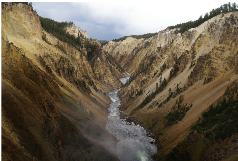
Рис. 47. V-образная долина. Йелостоун