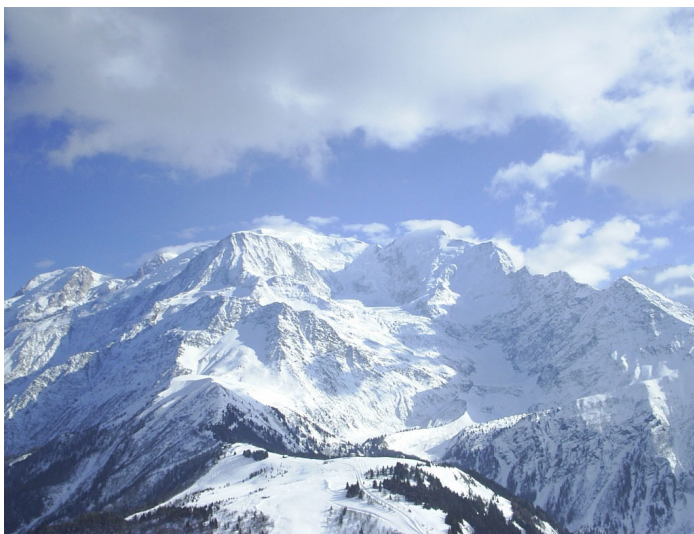
Рис. 40. Горы складчатые эпигеосинклинальные. Альпы. Монблан