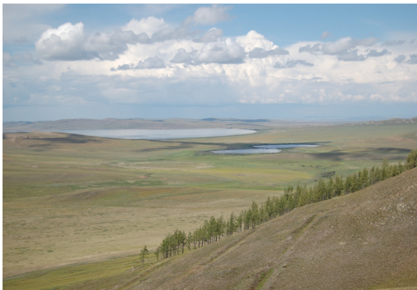
Рис. 42. Минусинская межгорная впадина

– впадина межгорная – со всех сторон граничит с горными сооружениями. Предгорья и предгорные равнины расположены концентрически (рис. 42);