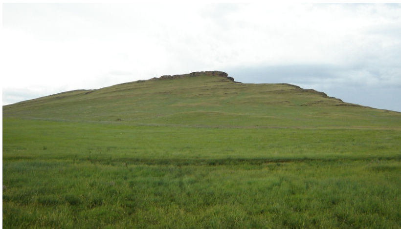
Рис. 51. Склон структурно-денудационный (куэста). Хакасия