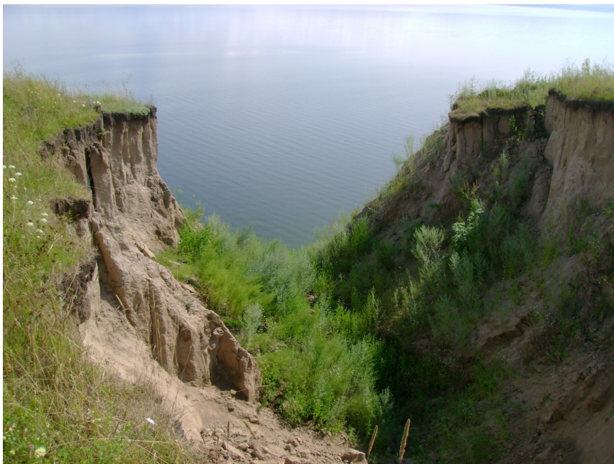
Рис. 49. Овраг. Красноярское водохранилище

Балка (лог) – сухая или с временным водотоком долина с пологовогнутым дном, выпуклыми задернованными склонами. Длина до нескольких десятков километров, ширина до 100 м, глубина – десятки метров. Представляет собой позднюю стадию развития оврага.