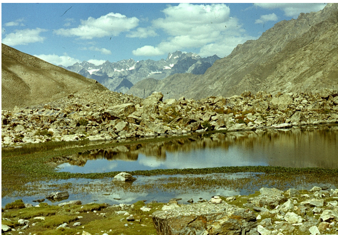
Рис. 16. Моренные отложения и приледниковое озеро. Шахдаринский хребет. Юго-Западный Памир