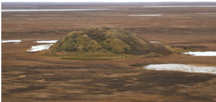
Рис. 25. Бугор пучения ( http://www.saon.ru/ )

Пучение грунтов (пучение мерзлотное, пучение криогенное) – деформация дневной поверхности, выражающаяся в поднятии или вспучивании почвы (или грунта) вследствие изменения их объема при промерзании, расширении промерзающего слоя в результате перехода воды в лед и набухания содержащихся в грунте коллоидов (рис. 25). Это сопровождается раздвиганием частиц скелета грунта либо за счет промерзания влаги на месте, либо при воздействии напорной воды, поступающей к промерзающему слою со стороны.