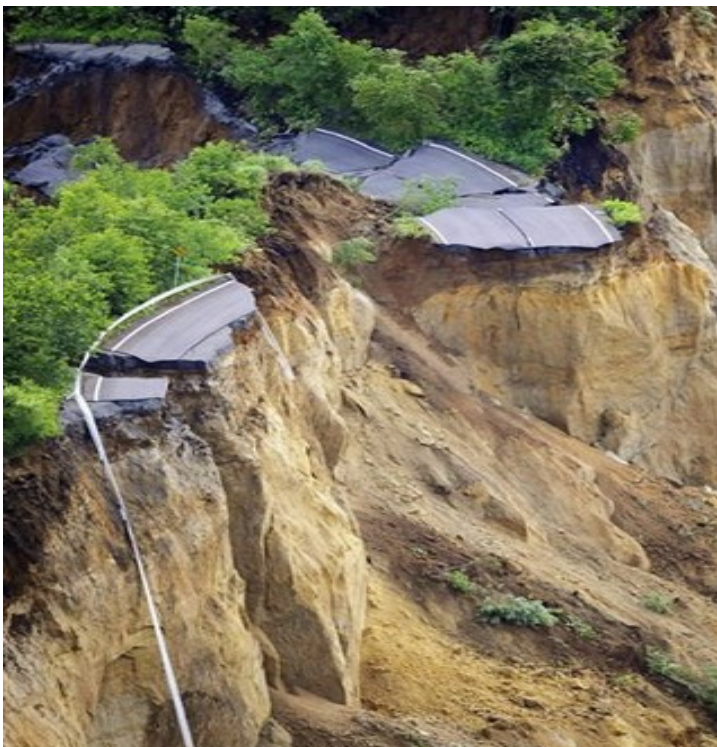
Рис. 5. Оползание по сейсмогенным трещинам отрыва. Япония ( http://www.fedpress.ru/socium/world/id )

1. С быстрыми сейсмогенными движениями земной коры (рис. 5).