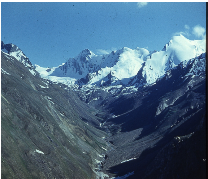
Рис. 11. Проявление эрозионных процессов на фоне тектонического поднятия. Юго-Западный Памир, Шахдаринский хребет, долина Тусион

Влияние современных тектонических движений и морфоструктурного фактора в целом выражается в усилении процессов эрозии на участках достаточно интенсивных тектонических поднятий земной поверхности (рис. 11), аккумуляции осадков в районах преобладающего опускания земной поверхности.