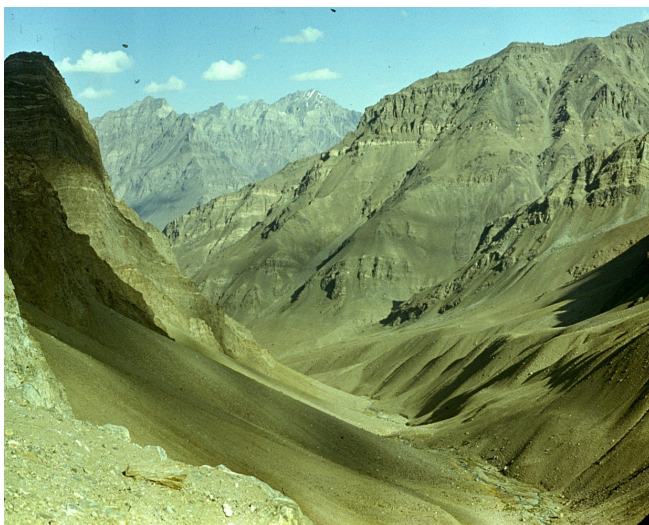
Рис. 41. Горы эпиплатформенные. Юго-Западный Памир, р. Тусион