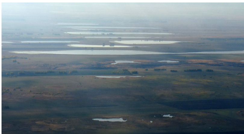
Рис. 46. Гривы (Барабинские степи). Видны межгривные впадины, заполненные талыми снеговыми водами