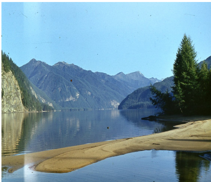
Рис. 6. Озеро Азульское (Восточный Саян) – рифт (фото С.А. Ананьева)

континентальная долина – первично тектонический элемент рельефа, который может быть изменен экзогенными процессами и представлен вытянутой впадиной, образованной опусканием блока между субпараллельными нормальными сбросами, падающими навстречу друг другу. В настоящее время под рифтовой долиной в более широком смысле понимают грабен, выраженный в рельефе, а термин рассматривается как синоним рифта;