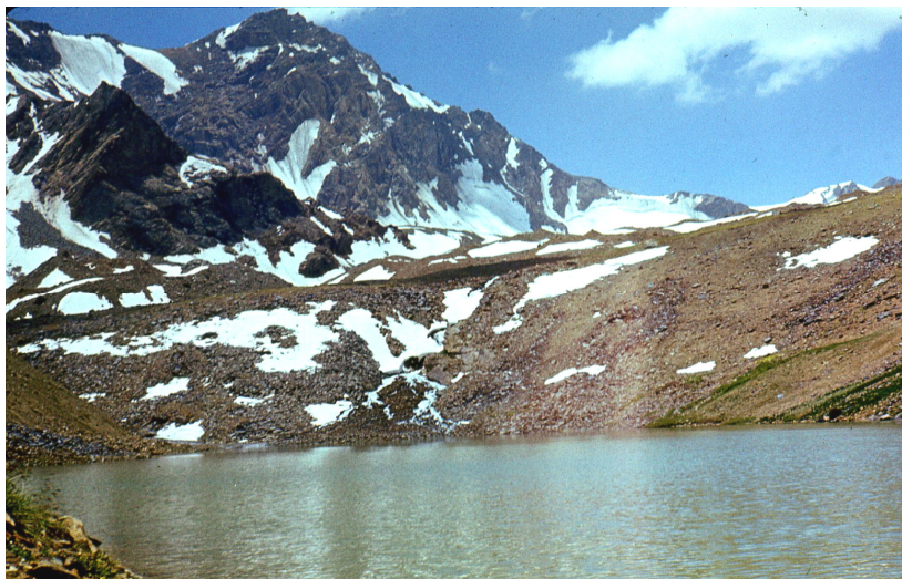
Рис. 21. Высокогорное приледниковое озеро. Шахдаринский хребет. Юго-Западный Памир