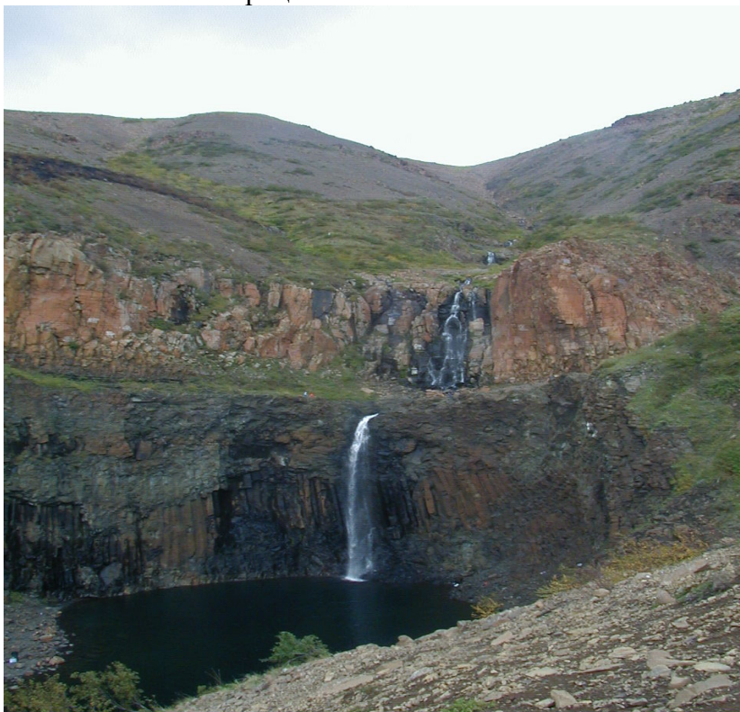
Рис. 3. Водопады на горной реке. Таймыр

Эндогенные процессы определяют различные типы тектонических движений и связанных с ними деформаций. Они являются также причиной землетрясений, магматизма (эффузивного и интрузивного). В совокупности эндогенные процессы не только способствуют возникновению разнообразных по морфологии и размерам форм рельефа, но часто контролируют характер и интенсивность деятельности экзогенных процессов.