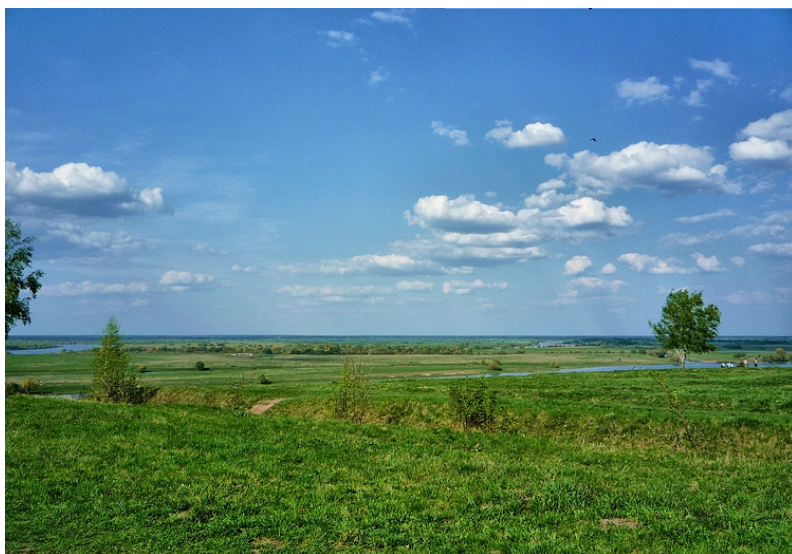
Рис. 35. Русская равнина