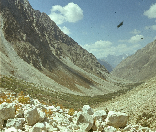
Рис. 28. Пролувиальные конуса выноса. Юго-Западный Памир