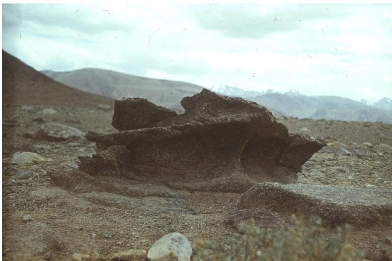
Рис. 34. Процессы корразии. Юго-Западный Памир