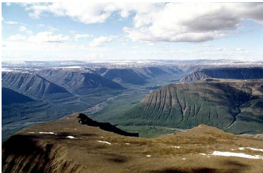
Рис. 37. Плато Путорана. Красноярский край

Нагорье – обширная высокоподнятая горная область, состоящая из отдельных горных узлов, массивов, хребтов, плоскогорий, межгорных понижений (рис. 38, 39).