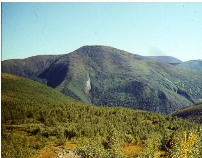
Рис. 39. Нагорье Кузнецкий Алатау