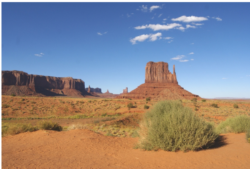
Рис. 44. Горы останцовые. Гранд-каньон (США)

Увал – невысокая, сглаженная возвышенность с пологими склонами, вытянутая в длину, без ясно выраженного подножия, с относительной высотой до 200 метров.