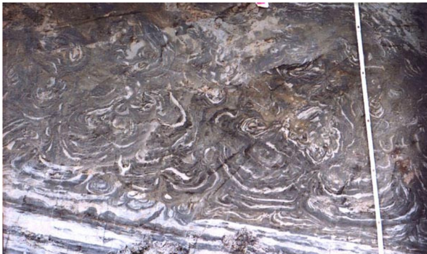
Рис. 24. Крйотурбация

рений, загибов, колец, «котлов кипения», клиньев. Часто разделяются на инволюции (грибообразной формы) и инъекции (боковые восходящие ветви) (рис. 24).