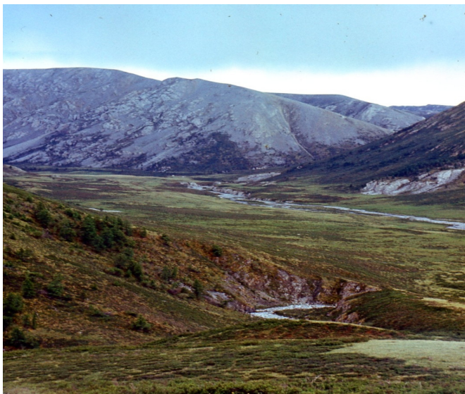
Рис. 38. Нагорье Сангилен, р. Сольбердер – г. Шук