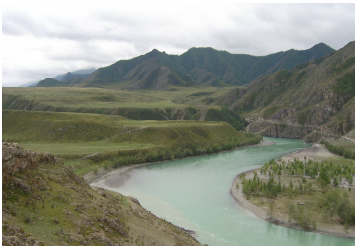
Рис. 18. Процессы меандрирования и террасирования. Река Катунь. Горный Алтай