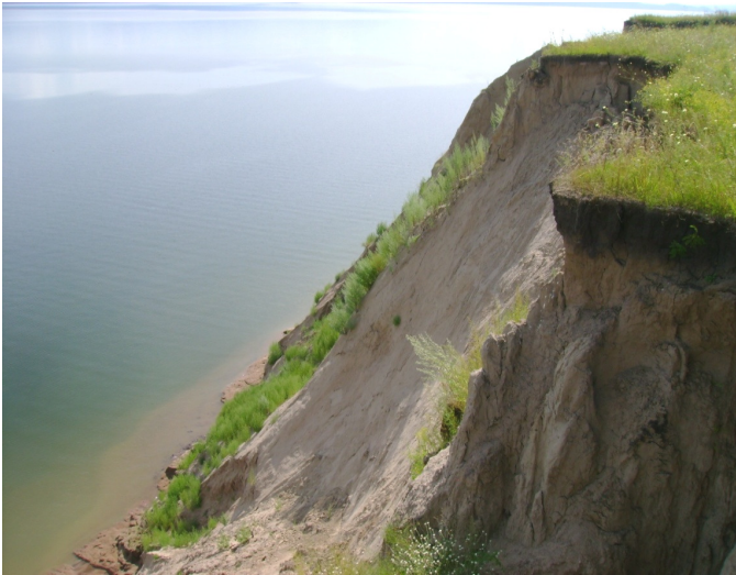
Рис. 29. Процессы осыпания. Красноярское водохранилище