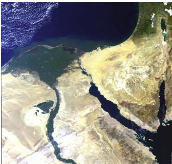
Рис. 8. Дельта Нила и Синайский полуостров ( http://dic.academic.ru/ )

– с медленными колебательными движениями земной коры (рис. 8);