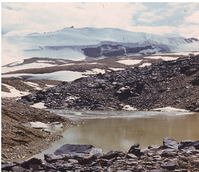
Рис. 17. Ледниково-нивальные процессы. Юго-Западный Памир