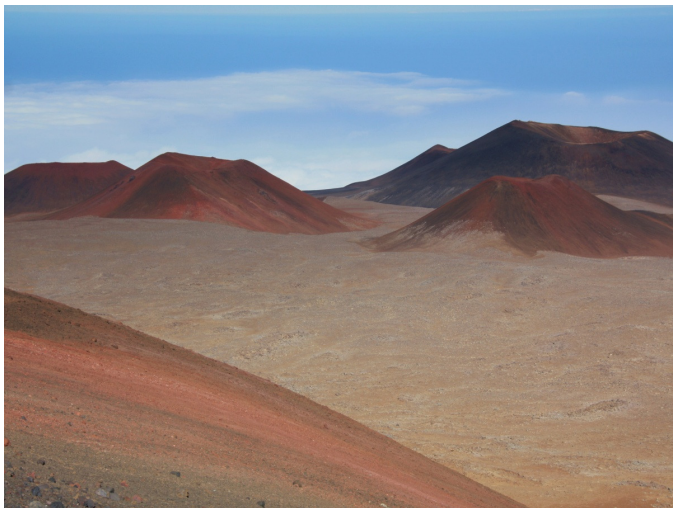
Рис. 9. Современные вулканы. Гавайи

3. С современным вулканизмом (рис. 9, 10);