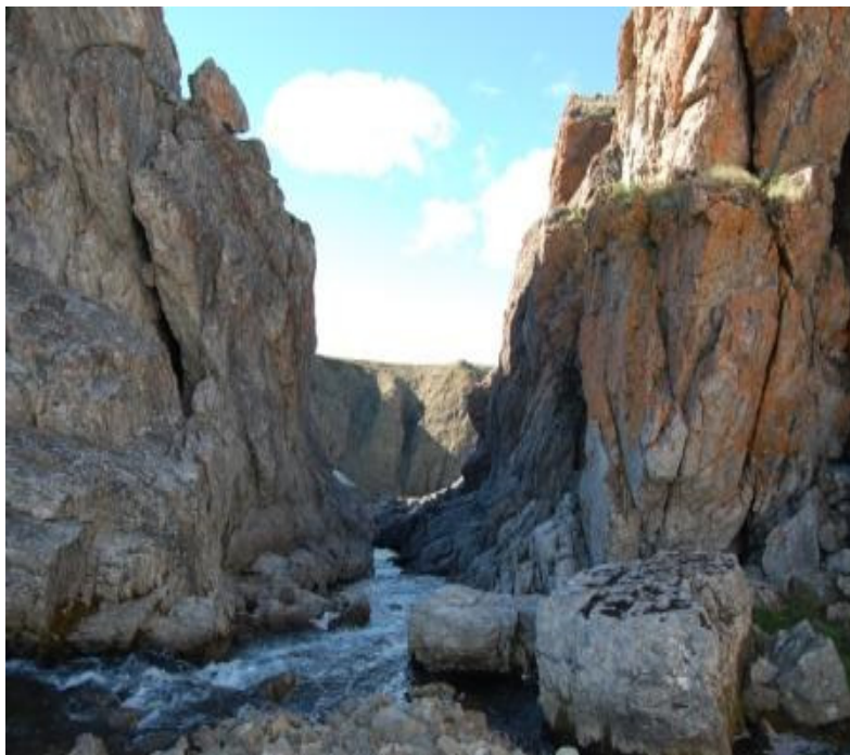
Рис. 2. V-образная долина горной реки. Таймыр

Форма долин рек плоскогорья, их поперечные и продольные профили также определяются расположением силлов и даек. При пересечении реками интрузивных тел долины рек резко сужаются, приобретают каньонообразный, V-образный поверхностный профиль (рис. 2). Продольный профиль в этом случае характеризуется большими падениями с формированием шиверов, порогов, водопадов (рис. 3).