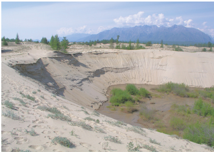
Рис. 32. Суффозионная воронка. Чарская пустыня

Дефляция (от. лат. deflare – выносить) – разрушительная деятельность ветра, выражающаяся в развевании и выдувании рыхлого (песчаного и алевритового) материала. Наиболее эффективна в пустынях, но может происходить в любых широтах. Результатом данного процесса может стать формирование каменистых пустынь – гамад (рис. 33).