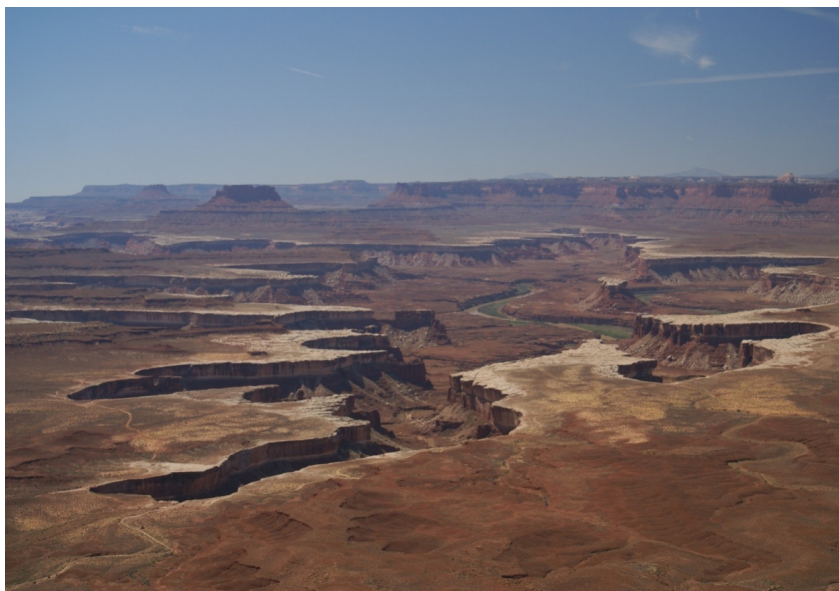
Рис. 36. Гранд-каньон. США

Плато – возвышенная территория с ровной волнистой, слабо расчлененной поверхностью, отделенная отчетливыми уступами от соседних пространств. Речная сеть обычно конькообразная. Выделяют плато структурное – на горизонтально- или моноклинально залегающих породах (рис. 36), вулканическое – на покровах лав, трапповое – на силах долеритов (рис. 37), цокольное – переходное между типичным плато и плоскогорьем и др.