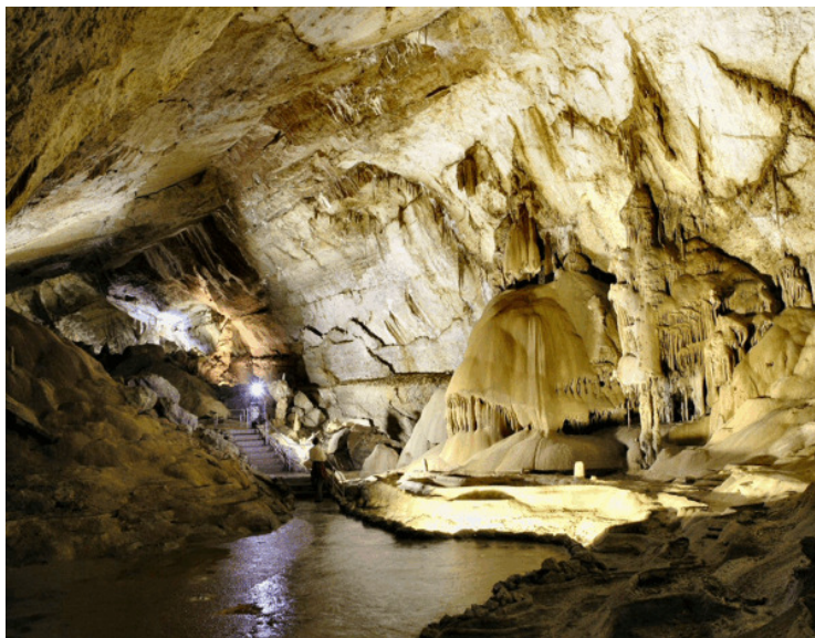
Рис. 13. Кунгурская пещера