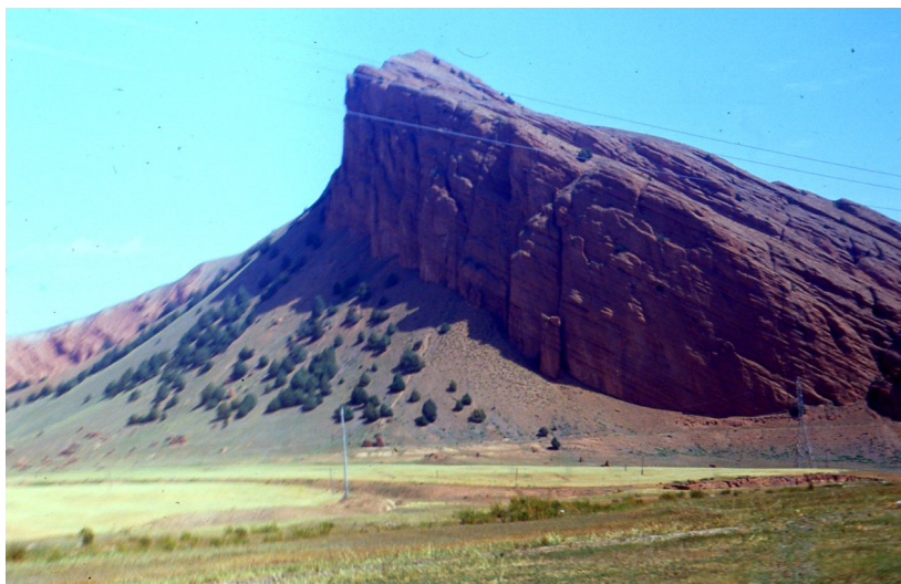
Рис. 43. Предгорная впадина. Куэстовые формы рельефа. Предгорье Тянь-Шаня

Предгорье – переходные между горными сооружениями и равнинами области. Пониженные окраинные части горных стран с холмистым, горным рельефом. Обычно связаны с определенными тектоническими структурами (предгорья поднятий, тектонического опускания с аккумуляцией, разрастающихся гор и сокращающихся гор).