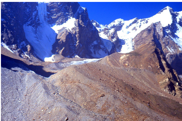
Рис. 20. Моренные отложения. Шахдаринский хребет. Юго-Западный Памир

Экзарация (ледниковая денудация) – разрушительная работа ледников в процессе их движения (рис. 22, 23).