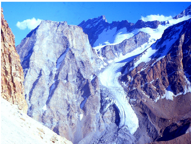
Рис. 22. Ледники на склоне пика Маяковского. Шахдаринский хребет. Юго-Западный Памир