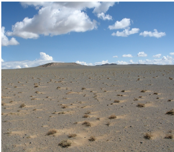
Рис. 33. Гамады. Западная Монголия