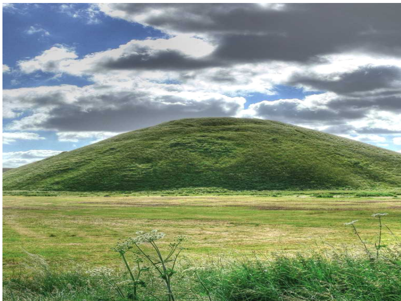
Рис. 45. Холм Силбури Хилл (Silbury Hill) – Великобритания