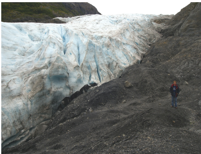
Рис. 23. Ледниковая экзарация и накопление моренных отложений. Аляска

Процессы перигляциальные – процессы на территориях с холодным климатом, где деятельность воды преобладает в виде твердого ее состояния, постоянного или периодического. Диагностические признаки: воздействие мороза, сезонное покрытие почвы снегом, наличие мерзлоты в грунтах – многолетней или сезонной, замерзание и таяние грунтовых вод.