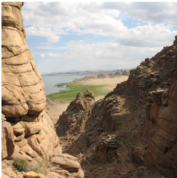
Рис. 12. Селективное выветривание различных типов горных пород. Монгольский Алтай

Влияние литологического и гидрогеологического факторов. Эти факторы являются весьма распространенными и нередко определяющими. Литологические и гидрогеологические свойства горных пород образуют своеобразную «материальную» базу для разных видов современных геоморфологических процессов. Менее плотные, легко размываемые породы способствуют усилению процессов денудации, тогда как плотные кристаллические породы тормозят развитие подобных процессов (рис. 12). Осадочные, магматические породы по-разному реагируют на физическое, химическое выветривание. В районах легко выщелачиваемых карбонатных пород активно развиваются карстовые процессы (рис. 13), а высокая степень водообильности горных пород способствует образованию оползней (рис. 14).