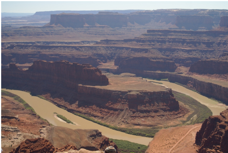
Рис. 48. Каньонообразная долина. Гранд-каньон