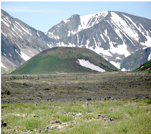
Рис. 10. Вулкан Кропоткина. Восточный Саян ( http://www.zin.ru/Animalia/Coleoptera/rus/ )