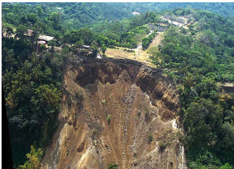
Рис. 14. Образование оползня ( http://www.bigup.ru/ )