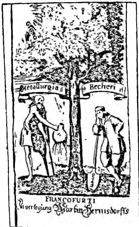
Рис. 3. Аллегорическое изображение системы рудных жил

Бэтман, касаясь этого же периода, дает его более краткую историю явно по книге Т. Крука, более четко резюмируя выводы. Отметив, что между Агриколой и Декартом было опубликовано мало сведений, Бэтман излагает представление Декарта о Земле как об остывшей звезде с горячим ядром, которое привело его к предположению, что рудные минералы были извлечены из глубокой металлоносной зоны в форме эманаций, а также вод поверхностного происхождения и отложены в виде жиллообразных залежей в трещинах земной коры.