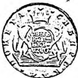
Рис. 4. Пятак, отчеканенный на Колыванском монетном дворе

«Змеиногорский рудник, который, — как говорит Ренованц, — оказался самый важнейший золотой рудник, ибо из всех руд на Алтае от 1745 по 1780 год 686 пудов 16 фунтов 49 золотников чистого золота по заводским пробам добыто было», в его работе охарактеризован очень ярко, по впечатлениям от личного посещения в 1778 г. [50].