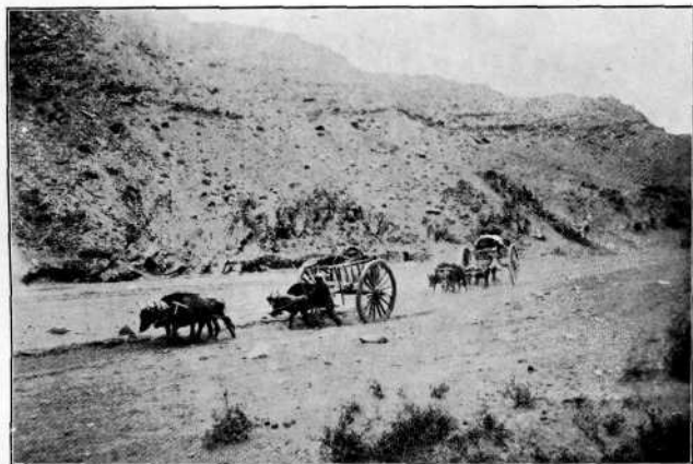
Рис. 4. Угленосная свита въ ущельѣ Цаган-тохойн-голь и китайцы съ арбами каменного угля.