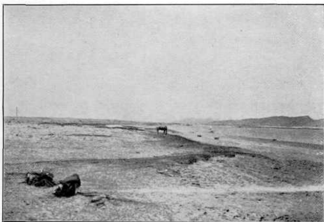
Рис. 2. Прорывъ Желтой рѣки черезъ Алашанскій хребетъ ниже сел. Шичзу-ице.