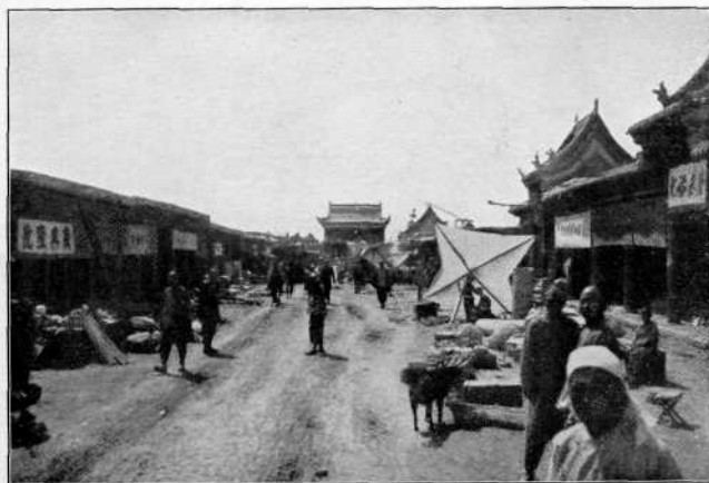
Рис. 6. Видъ на арку въ главной улицѣ Нин-ся съ восточной стороны.