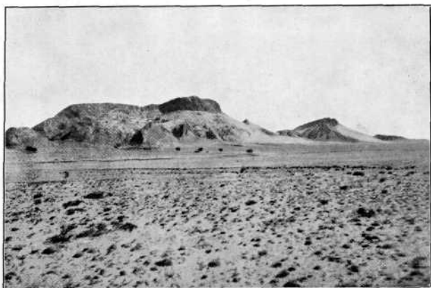
Рис. 3. Видъ съ юга на кумирню Намбарасэн-хить и гряды известняковъ.