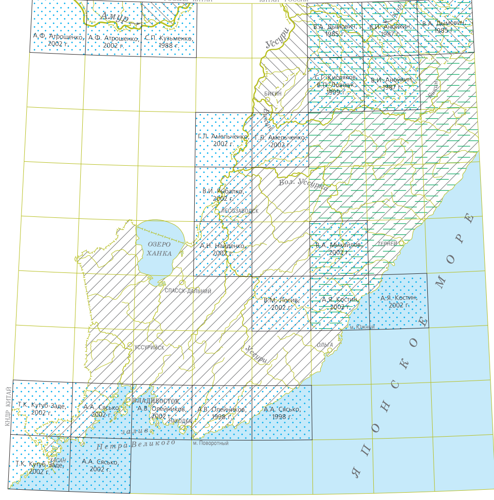
СХЕМА ИСПОЛЬЗОВАННЫХ МАТЕРИАЛОВ

УСЛОВНЫЕ ОБОЗНАЧЕНИЯ - Минерагеническая карта Приморского края масштаба 1 : 1 000 000 (М.Д. Рымашова, 2008 г.) - Карта геологической и орографической съемки и разведки металлов Приморского края масштаба 1 : 500 000 (М.Д. Рымашова, 2003 г.) - Карта полезных ископаемых Приморского края масштаба 1 : 500 000 (В.М. Сиренко, 1981 г.) - Минерагеническая карта Хабаровского края масштаба 1 : 500 000 (Н.М. Фомин, М.В. Мартынов, 1992 г.) - Карта полезных ископаемых масштаба 1 : 1 000 000. Лист L-53-B (А.С. Стуканов, А.А. Быхов, 1993 г.) - Государственная геологическая карта масштаба 1 : 200 000