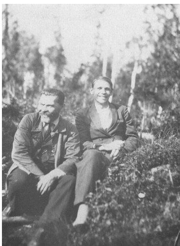
Кольский полуостров (1936 г.)