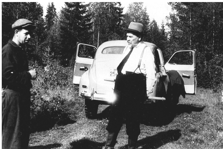
р. Пяльма, 1961 г.