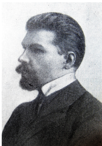
П.А. Борисов (1905 г.)