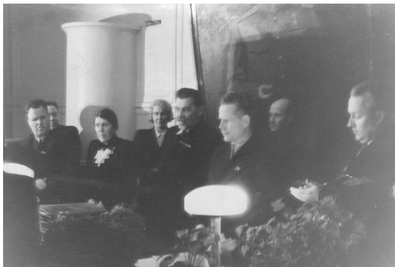
В первом ряду слева направо председатель Правительства КФ ССР П.С. Прокконен, В.Е. Борисова, П.А. Борисов, председатель Президиума КФФ АН СССР И.И. Сюкияйнен, В.И. Робонен, 1953 г.