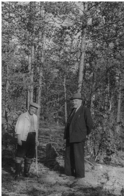
Заонежье, оз. Путкозеро Рудное поле «Хопунвара», около г. Питкяранта