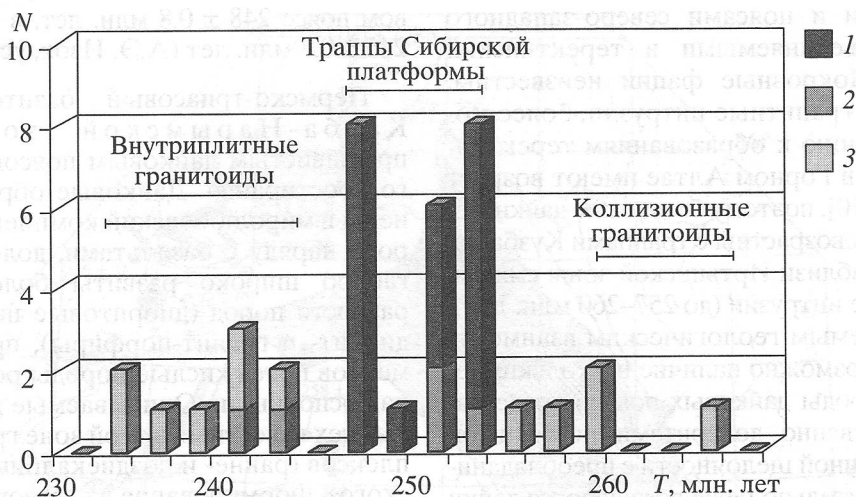
Рис. 2. Гистограмма радиологических возрастов ( T ) позднепалеозойских, раннемезозойских магматических и метаморфических образований западной части АССО. 1 – базиты, 2 – метаморфические породы, 3 – гранитоиды. N – число определений.

3) в то же время предельный объем гранитоидных батолитов с учетом их эрозионного среза и геофизических данных о положении подошвы не превышает 130000 \text{ км}^3 .