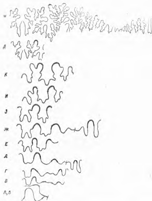
Рис. 2. Развитие лопастной линии в онтогенезе Partschiceras aff. subobtusum Kudernatsch:

пастей U и U^1 , через последнюю проходит шов. Вторая лопастная линия, на наружной стороне состоит из вентральной лопасти V и первой умбональной лопасти U . На спинной стороне наблюдается дорсальная лопасть D , окаймленная парой седел. Вторая умбональная и, по-видимому, внутренняя боковая лопасти на стенку раковины не проектируется, так как вторая перегородка боковыми частями упирается не в стенку раковины, а в высокие боковые седла первой перегородки. Третья лопастная линия состоит из пяти лопастей: ( V_1V_1 ) U U^1 J D .